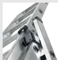
Beschläge mit Gleitführungen