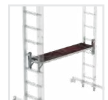
Bausatz- Arbeitsdiele Bestell-Nr. 30299