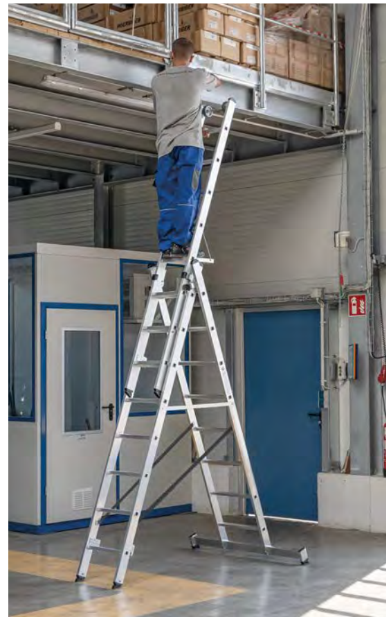
Abb. Bestell-Nr. 33308 und Bestell-Nr. 19910