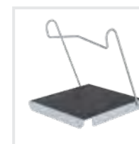
Einhängetritt R 13 Bestell-Nr. 19910