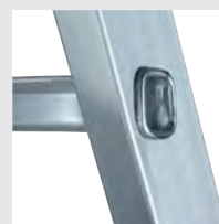
4-fach gebördelte Sprossen-/ Holmverbindung